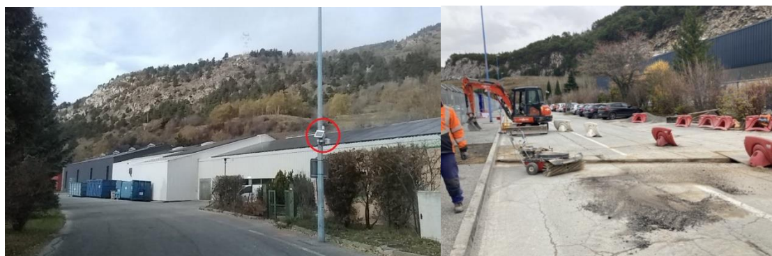
A gauche : point de mesure « Filtech » ; à droite : travaux ENEDIS du 23 au 25

De manière générale, les concentrations rue de l'Île ont été du même ordre de grandeur voire légèrement inférieures à Modane Est et Modane Piscine (en PM10 et PM2,5). L'accroissement de poids lourds n'a pas induit des concentrations plus élevées.