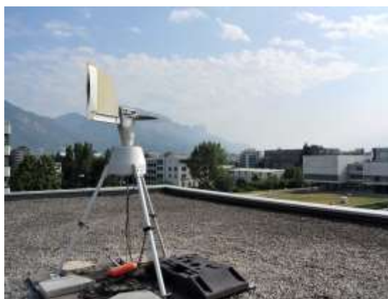
Capteur de pollens du site de Grenoble (44 avenue Marcellin Berthelot - GRENOBLE) Prélèvement à une hauteur de 20 m du sol