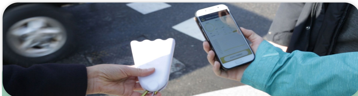
Les citoyens peuvent emprunter un micro-capteur mobile et mesurer les particules fines

En plus de mesurer leur air, les participants se verront proposer un accompagnement pour les inviter à mesurer des phénomènes de pollution extérieur ou intérieur caractéristiques, via des missions ou des challenges de mesure. Des fonctionnalités d'échanges et de partage ainsi que des ateliers avec les experts d'Atmo Auvergne-Rhône-Alpes complètent le dispositif.