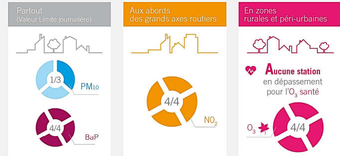
Part des stations au-dessus des seuils fixés par la réglementation européenne