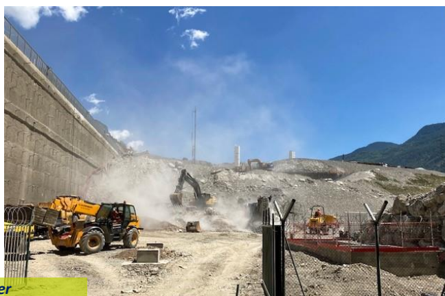
Photo du chantier

Dans ce cas, après prise de contact avec TELT, il s'est avéré qu'il y avait bien eu des émissions de poussières élevées au niveau du chantier, liées au fonctionnement d'un concasseur (cf. photo). Cette activité avait été stoppée, avant avertissement par Atmo Auvergne-Rhône-Alpes, en lien avec le constat visuel par les équipes sur place.